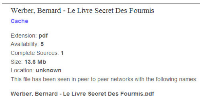
Capture d'écran d'un exemple de fiche d'ebook pirate référencé sur Figator

Nous avons par ailleurs contrôlé ces recherches avec, selon le même protocole, des recherches sur l'agrégateur Figator.