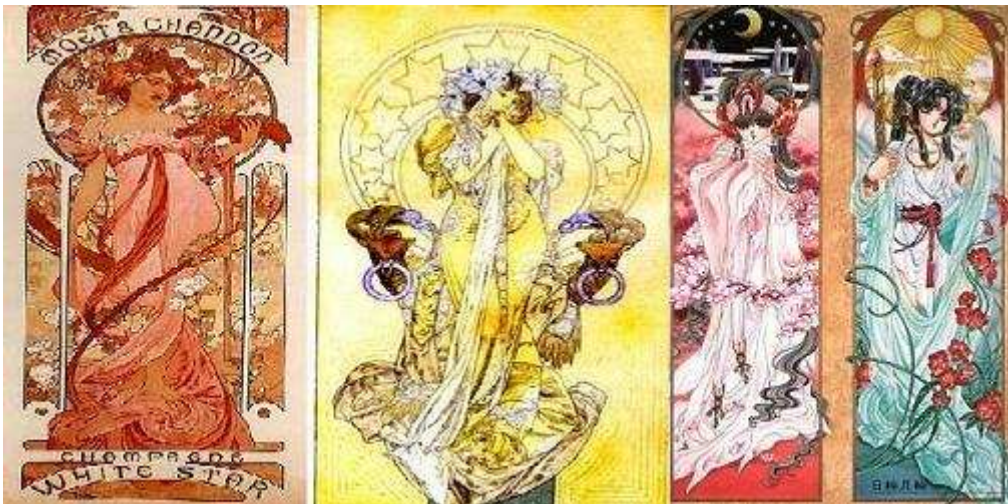
Figure 1 Illustrations de RG Veda par CLAMP © et affiches de Mucha

Mais si le légendaire asiatique a toute sa place, naturellement, dans les inspirations du manga, on peut en dire autant des mythologies occidentales. Représentatif de cette double influence, le studio CLAMP, parmi les plus prolifiques et les plus intéressants studios de mangakas, ne cesse de les faire s'entrecroiser pour créer une œuvre universelle et d'une grande originalité. Un de leurs titres phares, par exemple, X , est clairement construit sur une imbrication quasi inextricable entre l'imaginaire chrétien et les légendes asiatiques : on y retrouve aussi bien les « dragons de la Terre et du ciel » que des anges (c'est ainsi qu'apparaît la douce Kotoro, après sa mort, au héros Kamui, par exemple), sur fond d'Apocalypse. Par ailleurs, non contentes de puiser leur inspiration en Occident pour ce qui touche aux histoires racontées, elles affichent et assument l'influence qu'a l'Art nouveau sur leur esthétique. C'est ainsi qu'une œuvre comme RG Veda 29 , un autre de leurs titres phares, propose des personnages mannequins 30 dans des cadres explicitement inspirés des tableaux de Mucha.