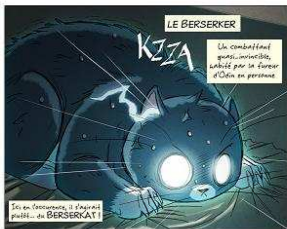
Figure 2 Vignette tirée du strip Berserkat de Maliki ©

En revanche, tout un courant de la bande-dessinée franco-belge s'inspire largement des codes graphiques et narratifs du manga pour les réadapter à la mode européenne. Et là, on assiste à quelques belles réussites, notamment chez l'éditeur Ankama. Nous pouvons ainsi mentionner le travail de Maliki 55 , qui a su digérer tous les codes graphiques du manga et de l'esthétique kawai pour créer son propre univers. Les strips qu'elle met en ligne chaque semaine sur son site 56 sont une belle preuve qu'il peut exister un universalisme de la bande-dessinée. Ainsi, on trouve sur ses petits personnages les gouttes de sueur, veines qui battent et autres traits de confusion propre au manga et qui servent à exprimer des émotions précises, tout en retrouvant par moment le souci du détail propre à la franco-belge ou aux comics.