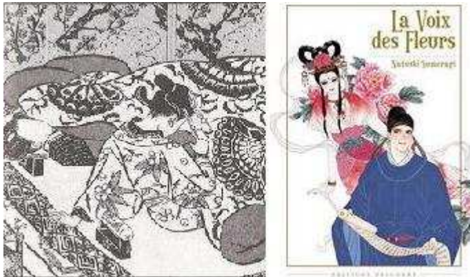
Figure 6 Oreillers de laque, Sugiura Hinako © et La Voix des fleurs , Sumeragi Natsuki ©

L'autre mise en valeur possible, nous le disions est de faire le même travail mais de façon visuelle, cette fois, par le biais de présentation de documents, en mettant par exemple en regard le manhwa Les Mille et une nuits et les contes dont il est librement inspiré, ou encore les œuvres de Sumeragi Natsuki ou de Sugiura Hinako avec des monographies sur les estampes chinoises (pour la première) ou japonaises (pour la seconde).