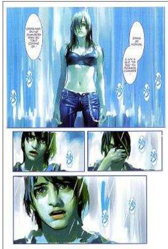
Figure 4 Planche extraite de Remember de Benjamin ©

De même pour l'animation, le festival d'Annecy décerne régulièrement des prix à des œuvres nippones, qu'il s'agisse de longs métrages ( La Traversée du temps , mention spéciale en 2007) ou de courts métrages ( La Maison en petits cubes , Cristal d'Annecy 2008).