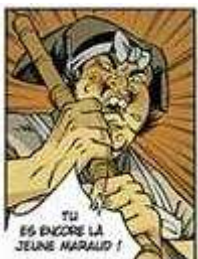
Figure 3 Vignette tirée du vol. 4 d' Okko de Hub ©

De même, certains auteurs publiés chez des éditeurs traditionnels reprennent-ils parfois quelques inspirations du manga dans une œuvre par ailleurs typiquement franco-belge dans sa construction. Nous pensons par exemple à Okko de Hub 57 dont l'image ci-dessous pourrait être directement tirée d'un manga japonais, avec ses traits qui renforcent l'exclamation du personnage