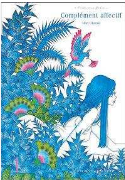
Figure 5 Complément affectif , Okazaki Mari©

Nous avons vu qu'un certain nombre de bibliothèques proposent déjà des bibliographies thématiques sur le manga. Jusqu'à présent celles que nous avons eu l'occasion de voir regroupent des titres de mangas, éventuellement complétées par des ouvrages sur le manga. Outre le fait que ces bibliographies ont tendance à se répéter, étant essentiellement orientées vers les « classiques » et quelques blockbusters, il nous paraîtrait beaucoup plus riche et porteur de sens de proposer des bibliographies croisées qui mettent en valeur l'œuvre de tel mangaka en regard de ses sources d'inspiration, par exemple. Il serait ainsi intéressant de mettre en regard l'œuvre de Yuki Kaori et ses sources d'inspiration dans la littérature et le légendaire occidental ( Ludwig Révolution et les contes de Grimm ; Fairy Cube , les mythologies celtes et Le Songe d'une nuit d'été ; Angel Sanctuary , la Kabale et La divine Comédie ; Comte Caïn , l'œuvre de Charles Dickens et l'histoire de Jack l'éventreur...), ou encore l'influence de l'Art nouveau sur le graphisme des mangakas (nous avons déjà parlé de CLAMP, qui l'affiche ouvertement, mais on retrouve cette inspiration chez Park Sang-sun, dont le Tarot Café fait inmanquablement penser aux dessins d'Aubrey Beardsley, mais aussi, de façon plus subtile, dans les décors floraux et animaliers du shôjo manga, particulièrement aboutis, dans leur délicatesse et leur précision chez Okazaki Mari, qui sont d'ailleurs une constante ...).