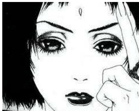
Figure 5 bis Tarot Café , Park Sang-sun ©