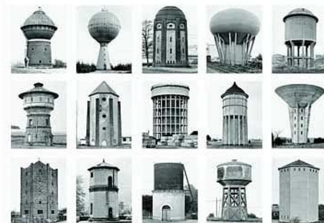
Illustration 6: Châteaux d'eau, Düsseldorf

Le fonds privé allemand de photographies Bernd et Hilla Becher 48 , couple de photographes installé à Düsseldorf et spécialistes des séries de monuments et de friches industrielles, celui-ci est pour une bonne part numérisée et accessible gratuitement via le site Google Images.