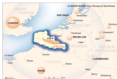
Illustration 4: Carte du Bassin Minier - ©Mission Bassin Minier

Le paysage du bassin minier est marqué par de nombreuses galeries, terrils et cités minières (appelées Coron). Il fut le terreau du roman d'Émile Zola, Germinal et le lieu de tristement célèbres tragédies humaines telle que celle de Courrières en 1906. Après un retrait du soutien de l'État en février 2011, la Mission Bassin Minier Uni entend de nouveau présenter un dossier en 2012.