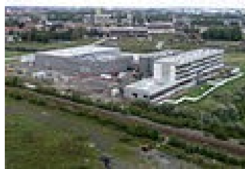
Illustration 4: Le CETI et la plaine Images