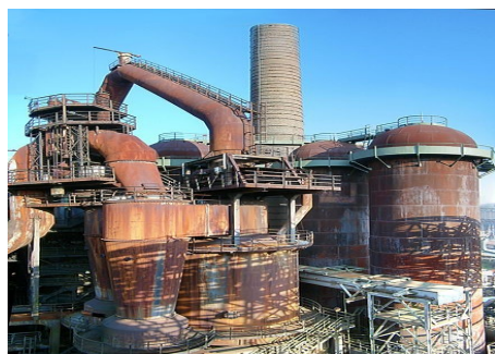
Illustration 3: Völklingen-Hutte.

C'est seulement depuis quelques années que l'intérêt pour les sites industriels s'est révélé. De grandes friches industrielles y sont désormais inscrites. Il faut attendre 1994 pour que l'Unesco classe pour la première fois un site industriel au patrimoine culturel mondial, il s'agit de l'usine de Völklingen-Hutte en Sarre (Allemagne) héritière des aciéries Röckling créées en 1881.