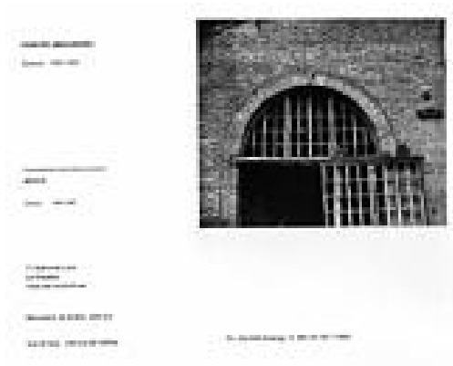
Illustration 2: Photographie de la Halle du Creusot

Le premier véritable site industriel à être classé en France reste celui d'une halle de construction de locomotives ferroviaires et une cité industrielle de la ville du Creusot en 1974. Celle-ci a depuis lors été transformée en Bibliothèque Universitaire.