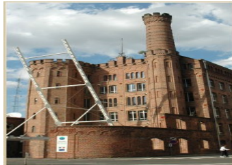
Illustration 5: Photographie du site des Archives Nationales du Monde du Travail

gouvernement de Nasser. La typologie de documents comporte outre là encore un fonds photographique de bâtiments conséquent microfilmée dont une partie est numérisée mais non complètement accessible en ligne, les archives imprimées de grandes sociétés industrielles aujourd'hui disparues par le biais notamment d'un fonds en provenance de la Société Industrielle du Nord. Ce à quoi il faut encore ajouter un important fonds de cartes postales et une tissu-thèque (échantillons de tissus ayant servi à la production industrielle photographiés) accessible en ligne.