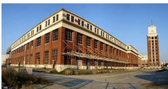
Illustration 1: Bâtiment de l'ancienne imprimerie L'illustration à Bobigny

Le symbole à ce titre est celui de la rénovation du bâtiment de l'ancienne imprimerie l'Illustration à Bagnolet. Le site est transformé entre 1995 et 2002 afin d'accueillir un Institut Universitaire de Technologie, IUT pour le compte de l'Université Paris 13. Son objet n'est plus de recréer des activités susceptibles de permettre le réemploi direct des anciens salariés mis au chômage à la suite des fermetures d'entreprises mais la formation des générations futures.