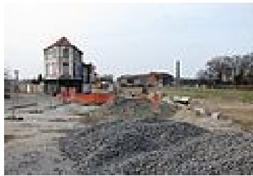
Illustration 3: Le café "Chez Salah" au milieu des travaux

L'entreprise numérique vient ici non pas valoriser mais remplacer l'entreprise industrielle, cet ancien instrument symbolisant le progrès et le développement économique désormais devenue verrue paysagère synonyme de tous les maux à éradiquer. Le 21 e siècle efface impitoyablement les vestiges du 20 e siècle. Elle se met au service de la valorisation commerciale du territoire afin de prouver que la désindustrialisation n'est pas une fatalité mais peut-être une chance en vue de permettre « un grand bond en avant » 128 . L'ambition avérée est bien celle d'un changement d'image complet de la métropole Lilloise qui se tourne inexorablement vers l'avenir des technologies numériques en vue de créer des emplois.