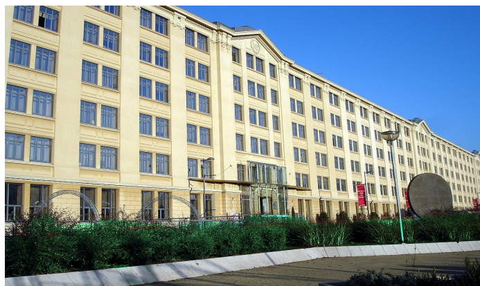
Illustration 2: Immeuble de Manufrance réalisé par Lemaizière reconvertis en pôle tertiaire

A la suite de sa fermeture en 1981, l'entreprise est d'abord reprise par une Société Coopérative de production 92 , SCOP fondée par 515 anciens salariés mais celle-ci dépose le bilan le 4 avril 1985. Les pouvoirs publics envisagent alors une reconversion spectaculaire prévoyant la création d'un musée dédié et d'une grande galerie commerciale. Projet finalement abandonné au profit d'une reconversion de type opportuniste en vue d'installer dans les bâtiments après rénovation des services administratifs (il s'agit ici d'un déplacement et non d'une création d'activités) et de grandes écoles 93 : l'ESC St Étienne, célèbre école supérieure de commerce vient y prendre ses quartiers, une extension de l'école des Mines ainsi qu'un centre de congrès, l'espace Fauriel 94 .