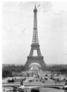
Illustration 1: Tour Eiffel - ©Base Mérimée

Un premier symbole industriel : la Tour Eiffel, structure érigée sur une hauteur de plus de 300 mètres d'altitude grâce à l'acier et qui fut créée pour l'Exposition Universelle de 1889 ne dut son maintien en place qu'à seulement une voix à l'issue d'un vote avant d'être finalement inscrite au titre des Monuments Historiques par arrêté du 24 juin 1964 24 puis au patrimoine mondial de l'Organisation des Nations Unies pour l'Éducation, les Sciences et la Culture, UNESCO, en 1991 (au même titre que l'ensemble des monuments parisiens) et de devenir le symbole de Paris et de la France que l'on connaît