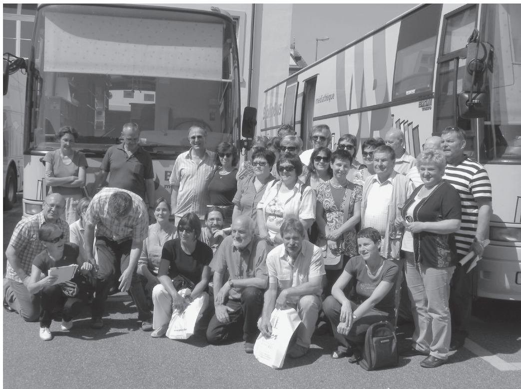
Visite de bibliothécaires de Slovénie.