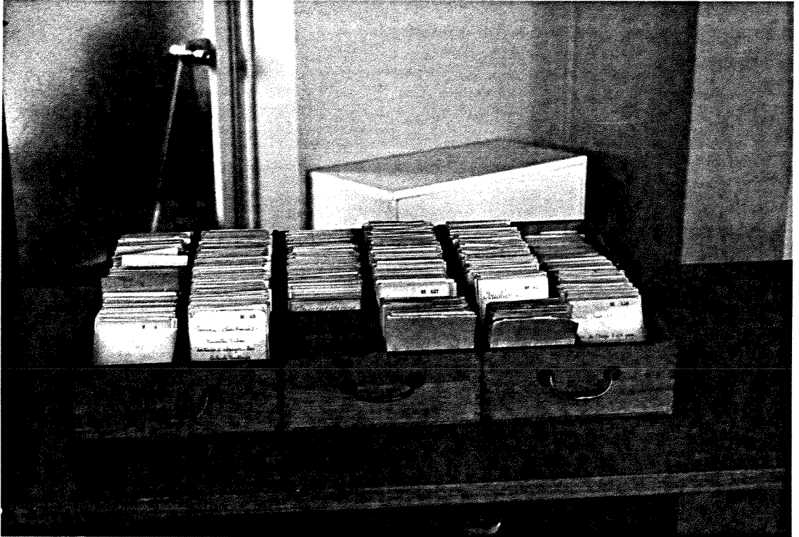
B.M. du Havre. Ancien fichier des romans (retrouvé au 4 e étage de la bibliothèque).