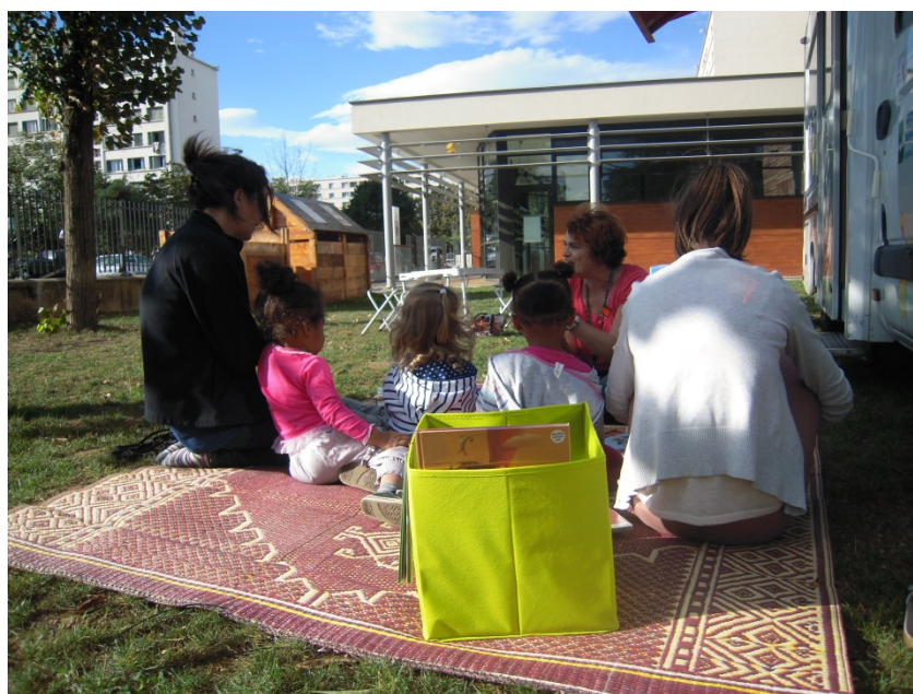
Des enfants de la crèche, accompagnés d'animatrices, viennent participer à une séance de lecture organisée par le service de bibliobus, jardin du centre social des États-Unis, Lyon 8 e , 9 octobre 2014.

séances de lecture lors de l'arrêt du bibliobus ; les habitués qui viennent prennent le temps de bavarder. Dans ce cas, l'intérêt du jardin consiste d'une part dans la clôture, de l'autre dans la présence de la nature (arbres et herbe) : deux caractéristiques qui invitent à la détente et à la convivialité, quand la rue est moins propice à la rencontre et à une pause véritable.