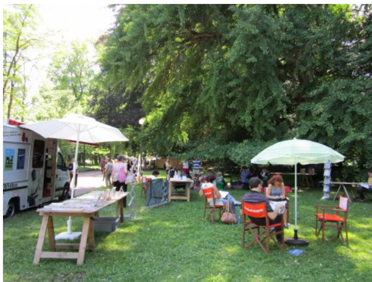
Dialogues en Humanité : la Bibliothèque municipale est présente avec un bibliobus, juillet 2014, source : BML, http://www.bm-lyon.fr/spip.php?page=agenda_date_id&source=326&event_id=47

Le bibliobus est une petite bibliothèque mobile et très visible, qui permet un contact avec le public très différent du contact en salle. Les passants non habitués de la bibliothèque peuvent rencontrer des bibliothécaires et des collections dans leur environnement quotidien et familial, sans nécessairement emprunter ou s'attarder longtemps. Ils s'arrêtent plus volontiers pour des petites animations et des ateliers, comme en a témoigné par exemple en septembre 2014 le succès d'un atelier de cuisine participative (organisé en partenariat avec des écoles et des associations), sur la cuisine pendant la Première Guerre mondiale. Parmi les abonnés à la bibliothèque, certains ne vont qu'au bibliobus, car ils y trouvent un lien humain qu'ils ne retrouvent pas dans les bibliothèques (à l'inverse, certains sont rebutés au contraire par la proximité trop grande avec les bibliothécaires et les autres usagers, dans le petit espace du bibliobus); d'autres cumulent les deux usages. En tous cas, le service de bibliobus est bien différent des activités « hors les murs » délocalisées dans d'autres murs : il s'agit de se mettre sur des lieux de passage.