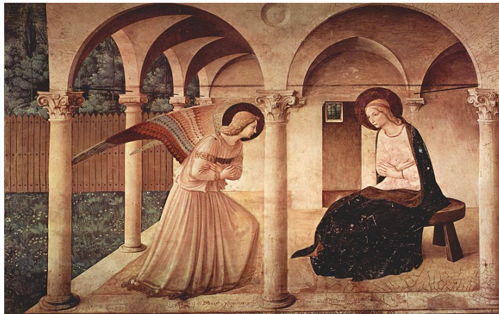
Fra Angelico, Annonciation, Couvent San Marco (haut de l'escalier menant aux cellules, corridor Nord), source : The Yorck Project: 10.000 Meisterwerke der Malerei. DVD-ROM, 2002 , via Wikimedia Commons [domaine public], http://commons.wikimedia.org/wiki/File:Fra_Angelico_043.jpg .

Lieu spirituel, lien à Dieu, le jardin monastique manifeste la façon dont la Création est tournée vers le Créateur. Il comporte, en théorie, quatre parties : un hortus ou jardin potager, un herbularius pour les plantes médicinales, un jardin bouquetier, et un verger, pour respecter l'édit de Milan (313) qui fixait pour les moines la règle de se soigner, de boire et de se restaurer, mais aussi de fleurir les autels 26 : utile et d'agrément, pour manger et pour contempler, il est image du monde dans son entier : « Le moine jardinier de la fin du treizième siècle est tout imprégné de la symbolique de ses quatre quartiers de jardin séparés symboliquement par les quatre fleuves de l'Apocalypse partant de la source centrale, préfiguration de la Jérusalem céleste 27 . » Au début de la Renaissance italienne, les Annonciations de Fra Angelico mettent en valeur cette valeur hautement spirituelle du jardin : l'ange se tient entre la maison, où se tient la Vierge, et le paysage extérieur, limité ici par une clôture :