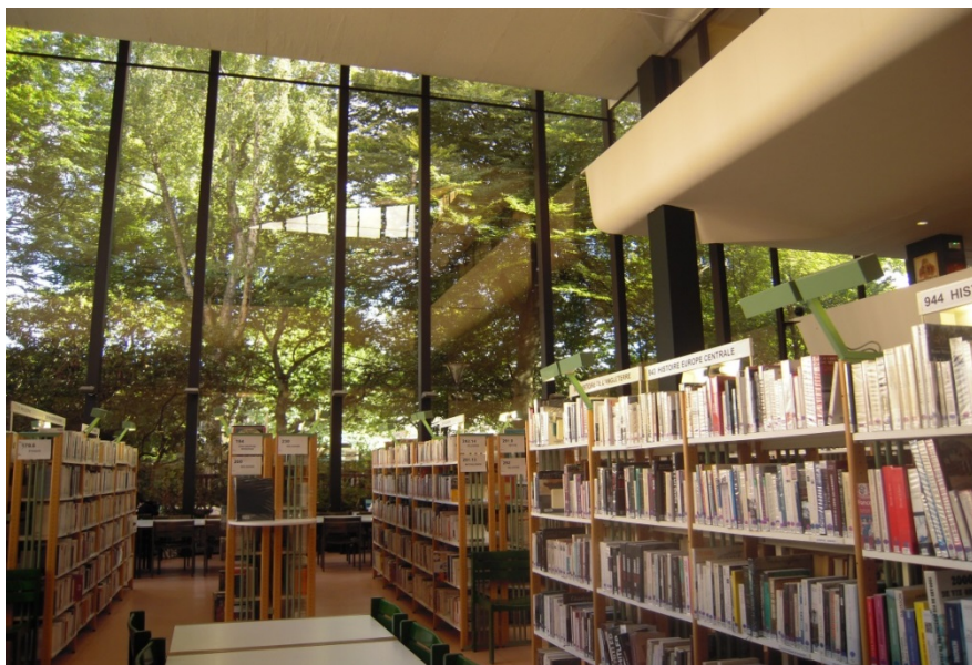
Bibliothèque municipale d'Angers, 27 août 2014.