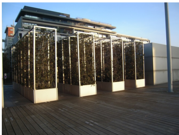
Esplanade de la BnF, 23 septembre 2014.

Cette forêt reste artificielle et exige une maintenance attentive ; les quelques dizaines de pins qu'elle contient, issus de la forêt de Fontainebleau et replantés là, ne tiennent debout que par la vertu de câbles d'acier. La moitié environ a survécu à ce déracinement initial. La forêt est facilement envahie par certaines espèces, comme le lierre et les ronces ; des invasions récurrentes de lapins depuis 2008 ont également exigé des interventions.