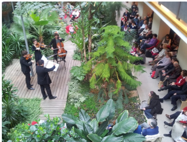
Concert dans le jardin de la Bfm de Limoges, 12 octobre 2013 (Daniel Legoff).

Les bibliothécaires utilisent aussi le lieu pour certaines animations, notamment des séances de lecture (contes pour les enfants, fin du parcours lors des visites de classes), pour des événements (concerts lors des journées du patrimoine, par exemple), et pour des expositions lorsque les objets s'y prêtent.