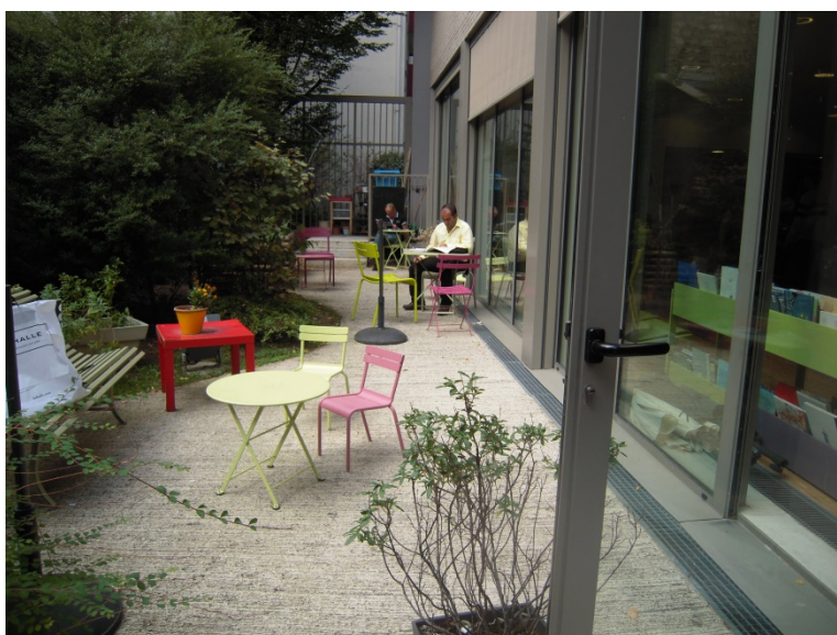
Bibliothèque Louise Michel, 4 octobre 2014.

Les risques pour les collections sont minimes. À partir du moment où les collections ne sont pas particulièrement précieuses et où les usagers peuvent les emprunter chez eux, pour un usage sans surveillance, la bibliothèque considère qu'elles ne sont pas plus en danger dans le jardin, ce qui n'a pour le moment pas posé de problèmes, de même que l'autorisation de boire et de manger dans la bibliothèque n'a pas particulièrement nui aux documents. Les lecteurs ont en général le réflexe de rentrer les ouvrages ; une seule fois en deux ans il a fallu récupérer des livres oubliés dehors par des enfants et menacés par la pluie.