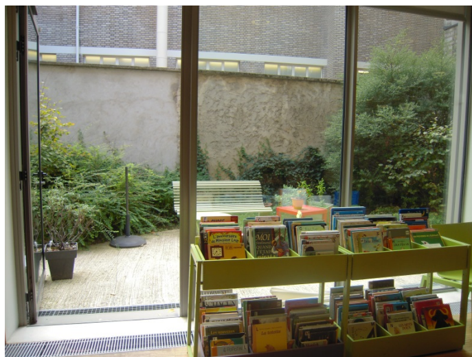
Bibliothèque Louise Michel, 4 octobre 2014.

La gestion quotidienne (arrosage, désherbage) du jardin, revient à la bibliothèque. La Ville intervient ponctuellement pour enlever des feuilles mortes.