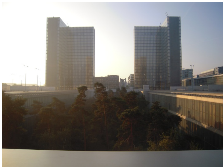
Vue de la BnF, 23 septembre 2014.

Le message est assez fort, et ce bout de nature à l'état brut enserrée par les quatre murailles du bâtiment semble signifier la parfaite maîtrise de l'homme sur la nature, et du livre sur la forêt, impression renforcée par les sortes d'arbres en cage qui entourent l'esplanade. À la BnF, la nature n'est donc pas domestiquée, puisqu'on n'y pénètre pas, mais elle est parfaitement maîtrisée : l'homme n'agit ni avec ni contre elle, mais la tient à bonne distance.