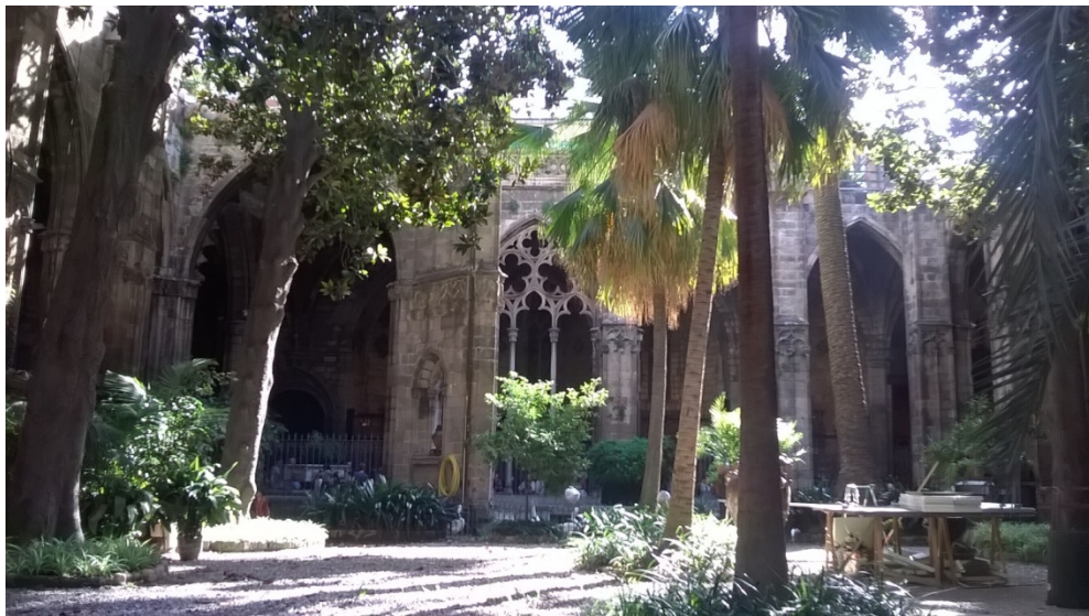
Cloître de la cathédrale Sainte Croix, Barcelone, 26/10/2014

Le cloître illustre bien le rapport du jardin à la conservation du « meilleur », comme le définit Gilles Clément 28 . Ce rapport peut faire craindre que le jardin ne devienne un espace figé pour l'éternité, un point fixe 29 . Mais le jardin du cloître, s'il est limité, n'est pas fermé : respiration au sein du monastère, il est un lieu de contemplation mais aussi de passage, où l'on se promène, où l'on converse 30 . Cette conservation du meilleur n'est pas contradictoire avec la vie, même si elle est avant tout intérieure pour le moine. François Jacob, dans son introduction à La logique du vivant , rappelle que deux notions sont associées par l'intuition aux êtres vivants : « la mémoire et le projet. (...) Ce qui caractérise notamment les êtres vivants, c'est leur aptitude à conserver l'expérience passée et à la transmettre 31 . » Mémoire et projet, conservation et transmission, préservation et création vont donc ensemble.