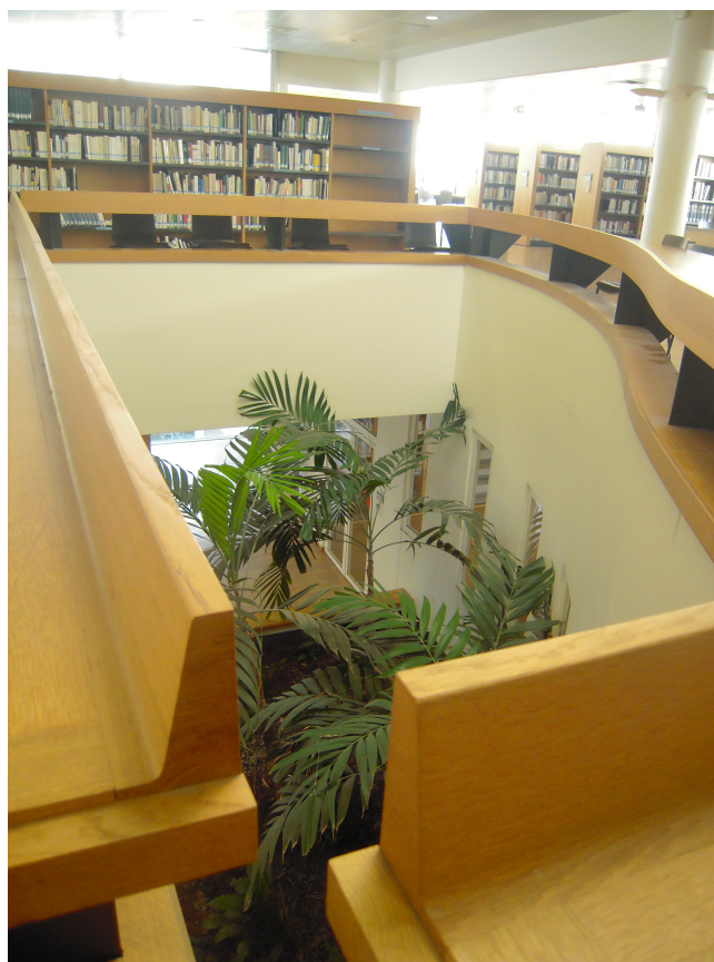
Bibliothèque de l'Université Paris 8, Saint-Denis, 4 octobre 2014.

l'architecture de la bibliothèque universitaire de Paris 8, telle que décrite ici par son architecte Pierre Riboulet : « Impossible de trouver ici un point à partir duquel on peut tout comprendre. On doit marcher. Ce faisant on éprouve, je l'espère, des sensations un peu étranges : monter ou descendre de façon subreptice, changer perpétuellement d'espace tout en restant dans le même espace, revoir un endroit déjà vu tout à l'heure mais tout autrement, d'autres encore... Le monde est inépuisable comme le sont les collections ici rassemblés 62 . » La bibliothèque de Paris 8 contient d'ailleurs des espaces de jardins intérieurs, sans aucun doute favorables à cette impression de promenade 63 .