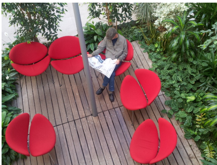
Jardin intérieur de la Bfm de Limoges, 17 octobre 2014.