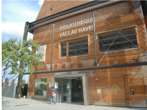
La bibliothèque Vaclav Havel (Paris 18 e ).