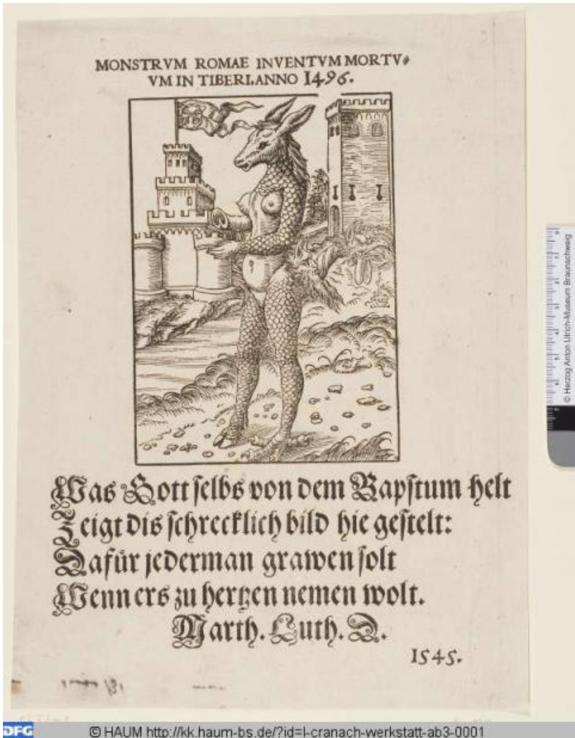
Gravure sur bois du graveur allemand Lucas Cranach l'Ancien (1472-1553) intitulée Der Papstesel éditée à Nuremberg datant de 1545. Dimensions : 14,5 x 10,6 cm. Conservée au Herzog August-Ulrich Museum à Braunschweig, cote LCranach-Werkstatt AB 3.1.