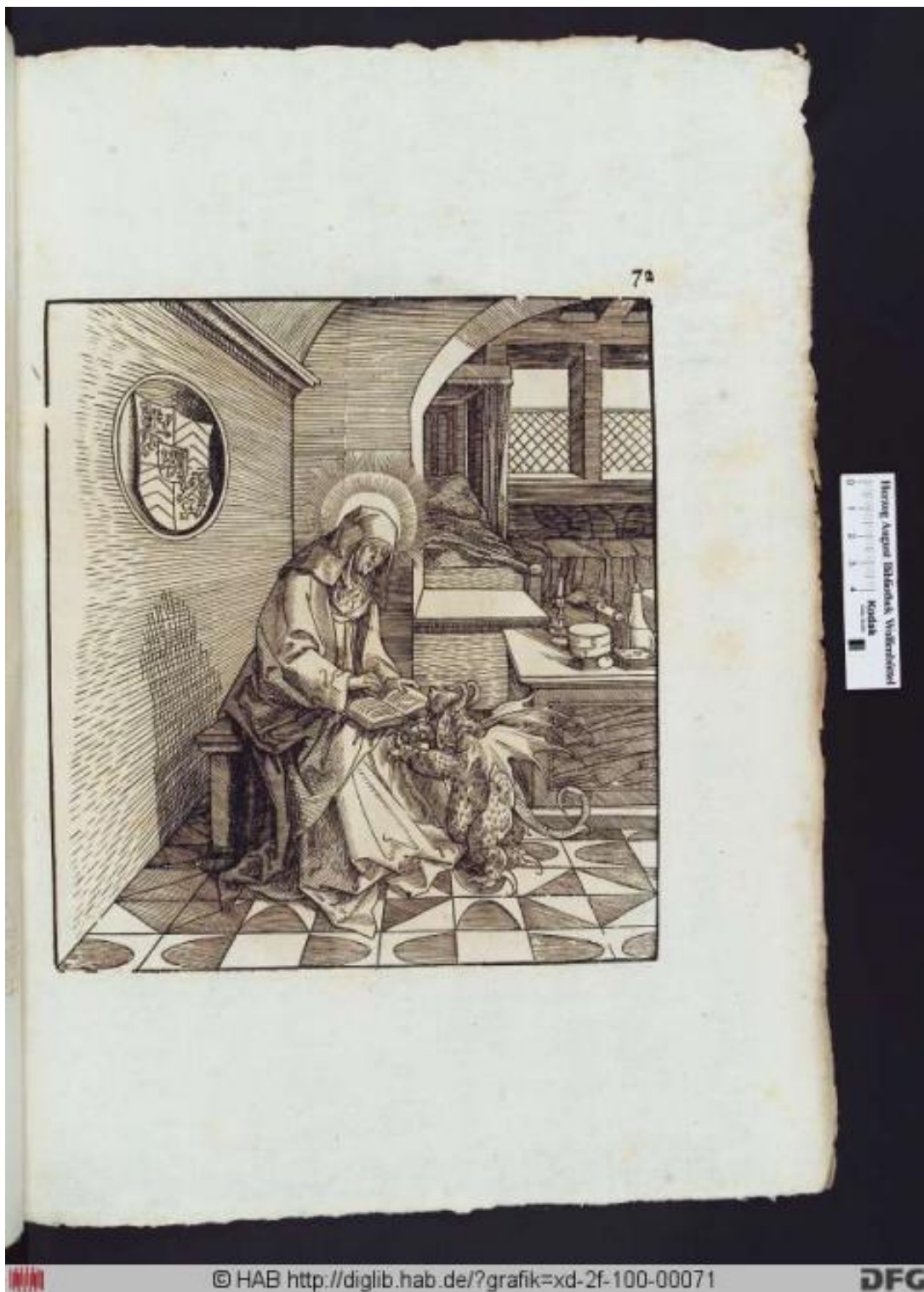
Gravure sur bois du graveur italien Cherubino Alberti (1553-1615) intitulée St. Madalberta datant de 1510. Dimensions : 41,9 x 30,2 cm. Conservée à la Herzog August Bibliothek à Wolfenbüttel, cote X2 2° 100 (72).