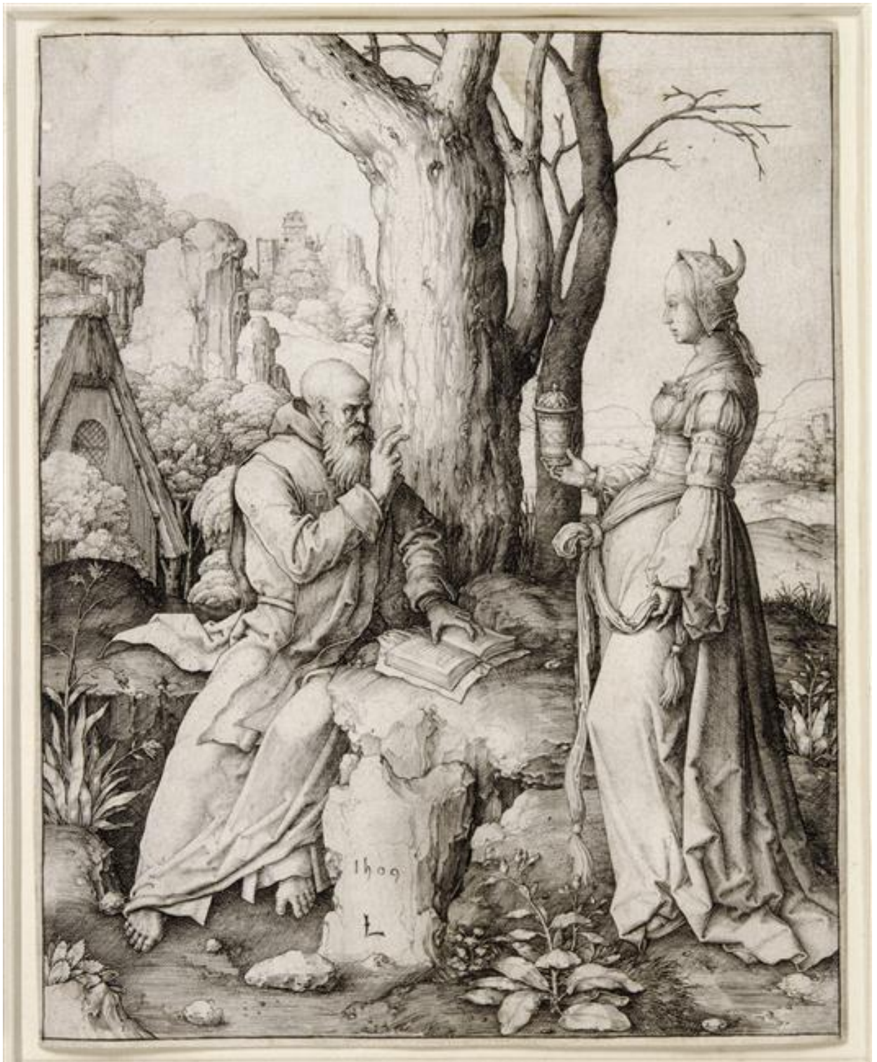
Gravure sur métal au burin du graveur néerlandais Lucas de Leyde (1494-1533) intitulée La Tentation de Saint-Antoine datant de 1509. Dimensions : 18,3 x 14,5 cm. Conservée au Musée du Louvre à Paris (coll. Rothschild), cote 97008810.