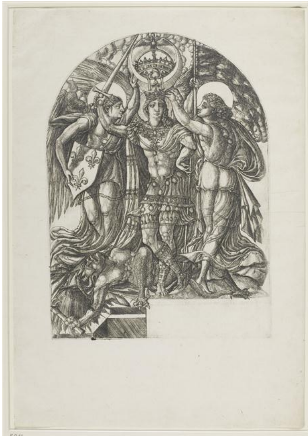
Gravure sur métal au burin du graveur français Jean Duvet (1485-1570) intitulée Henri II, roi de France, en Saint-Michel, terrassant le dragon . Dimensions : 40 x 27,8 cm. Conservée au Musée du Louvre à Paris, cote 4606LR.