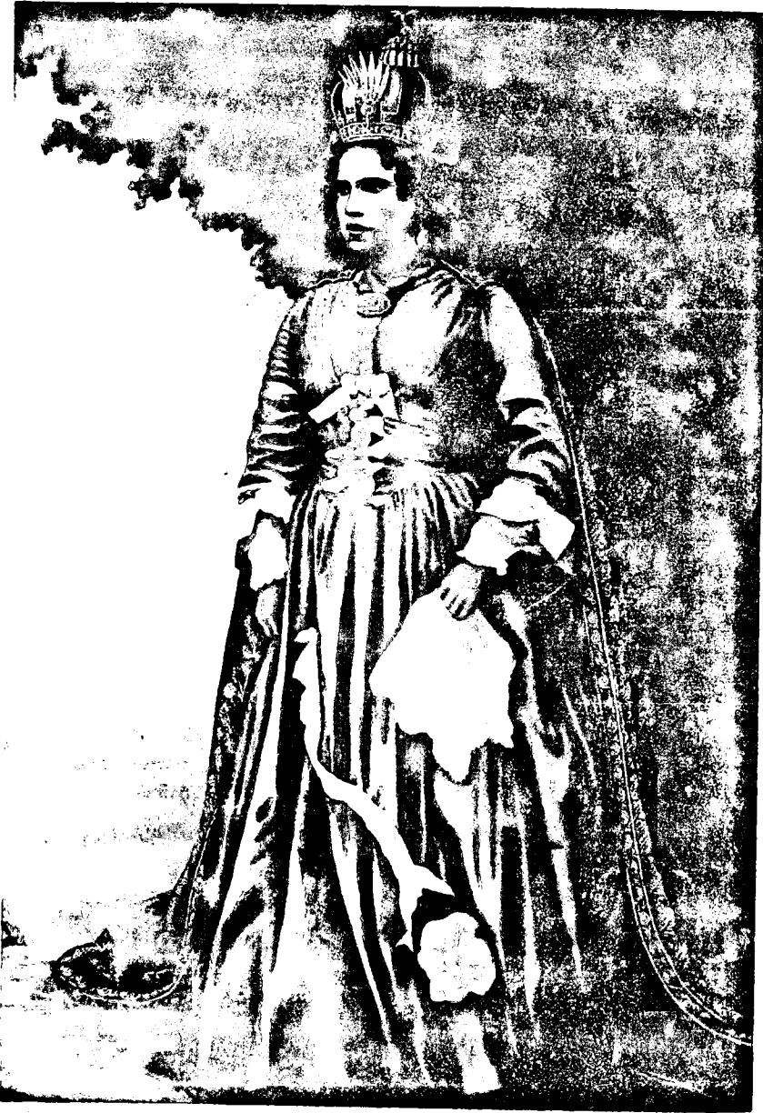
Ranavalona I re