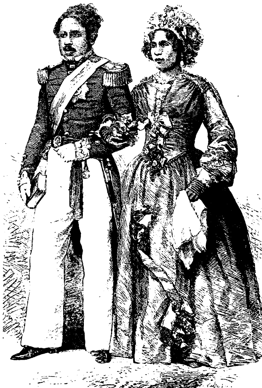
Radama II et Rasoherina