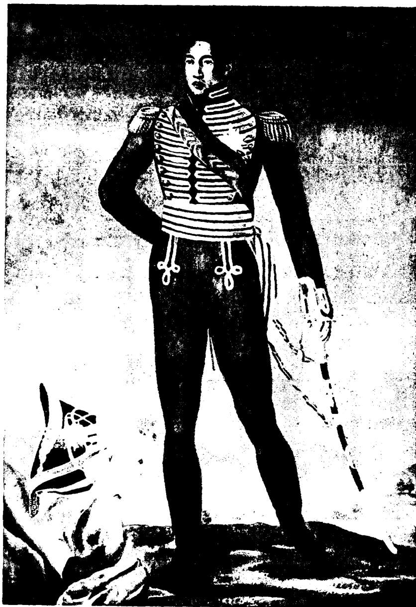
Radama 1 er peint par Coppalle