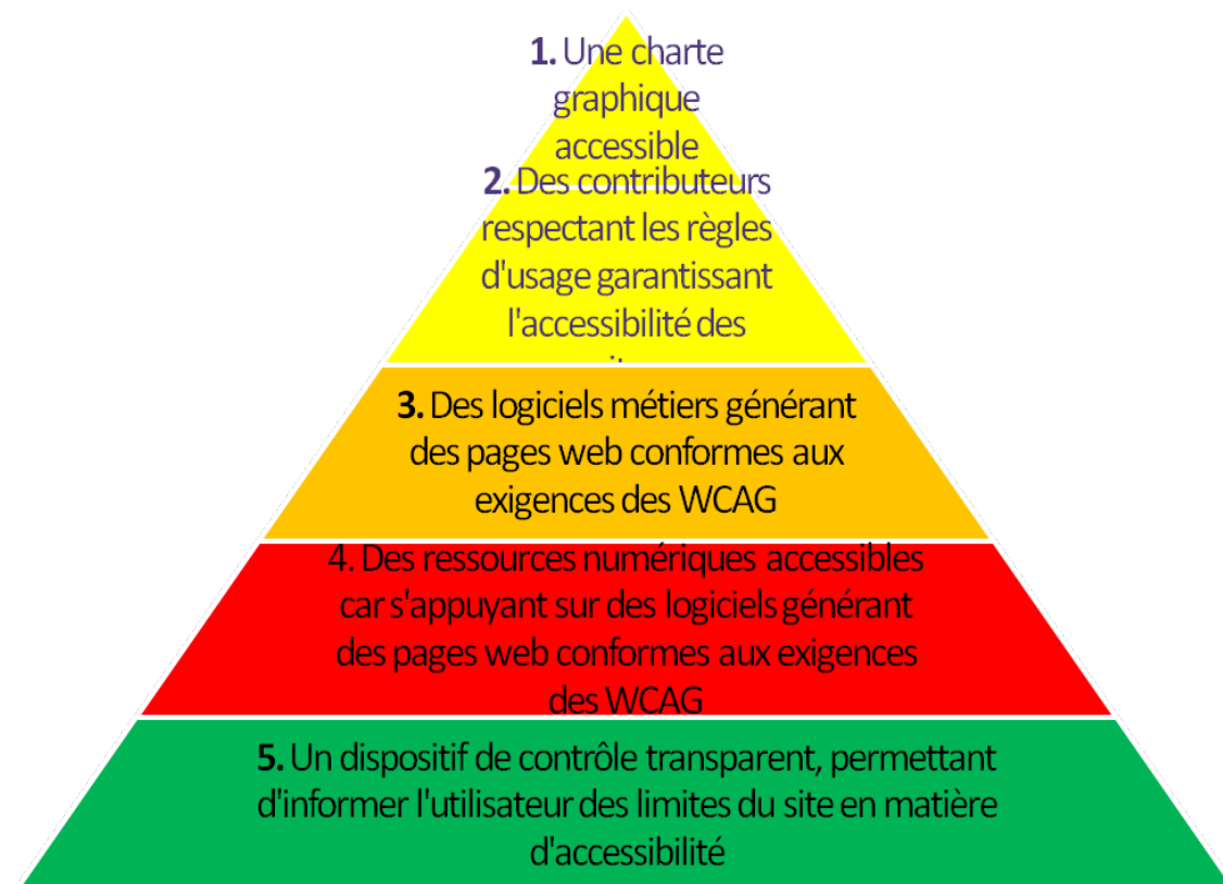
Schéma présentant une vision globale de la démarche et d'introduire sa présentation, in Bibliothèques accessibles ( www.bibliothequesaccessibles.fr ).

En pratique, l'accessibilité du site dépend de 4 facteurs. Il faut :