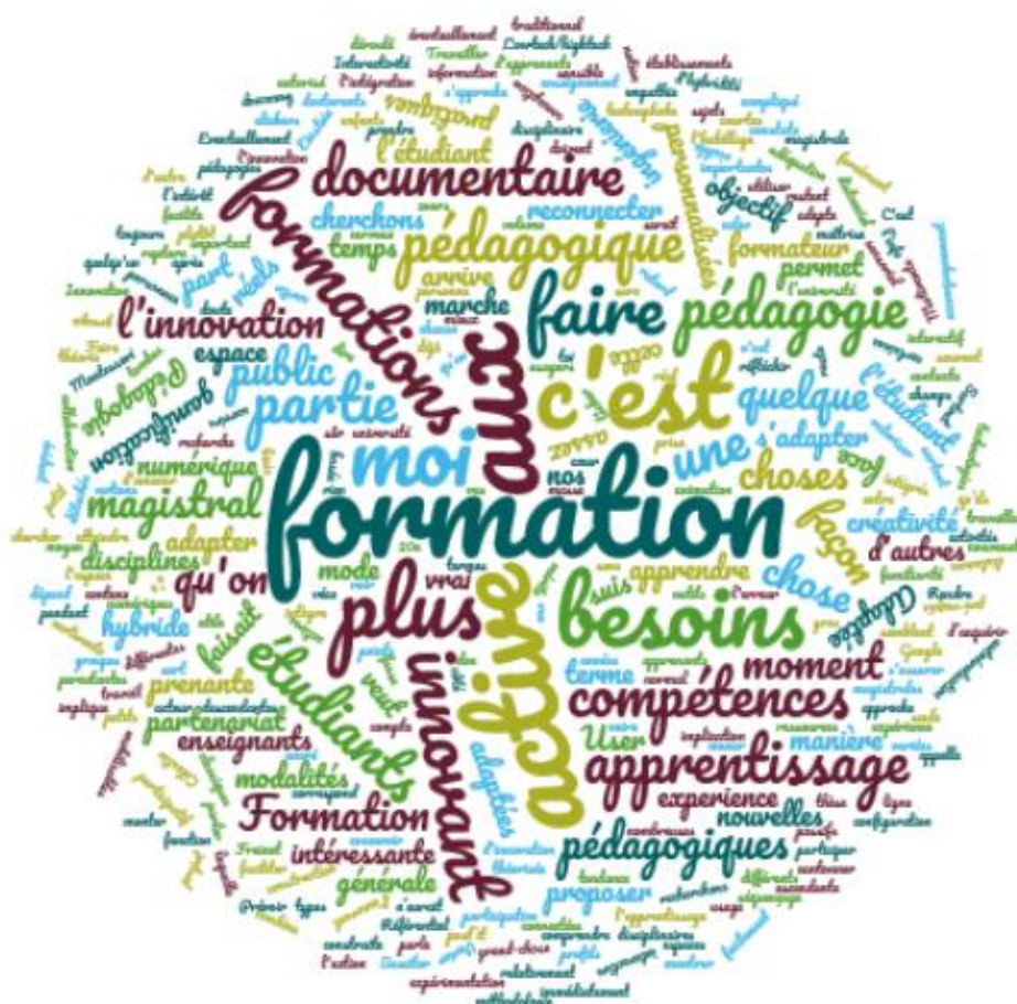
Nuage de mots construit à partir des réponses à la question « qu'est-ce qu'une pédagogie innovante ? », lors des entretiens menés dans le cadre de ce mémoire d'études 118

entre les enseignants (ce qui se rapproche de la notion d'« équipe pédagogique » évoquée dans le rapport StraNES), et une évaluation cohérente avec l'innovation mise en place - se retrouvent peu ou prou dans les définitions données par les personnes interrogées dans le cadre de cette étude. Les personnels des bibliothèques sont donc sensibles aux mêmes enjeux que les enseignants du supérieur.