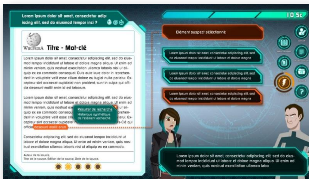
Ebauche d'un visuel du jeu Hellink 127

La BUPMC travaille actuellement sur l'intégration dans ses formations aux licences, d'un jeu vidéo produit et créé en interne : Hellink 128 . L'objectif de ce jeu