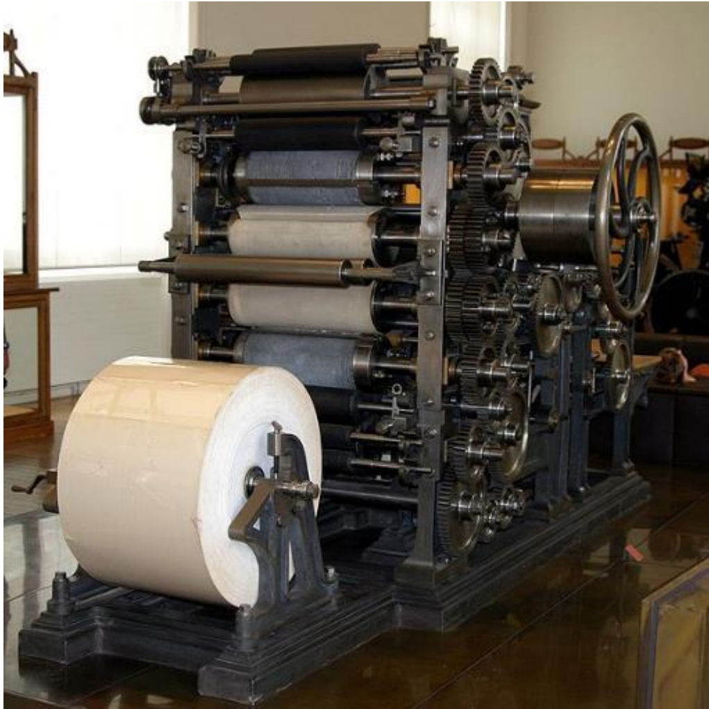
Rotative de Marinoni de 1883, exposée au Musée des Arts et Métiers.