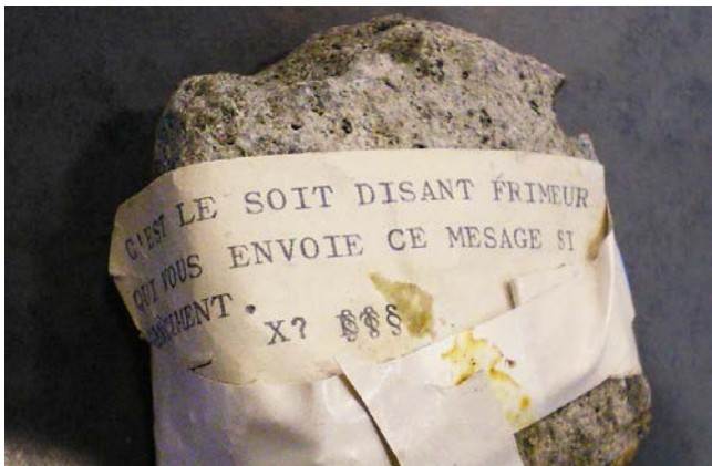
de Villiers-sur-Marne au début des années 1990 2 .

Photo 1. Pierre lancée contre la bibliothèque municipale