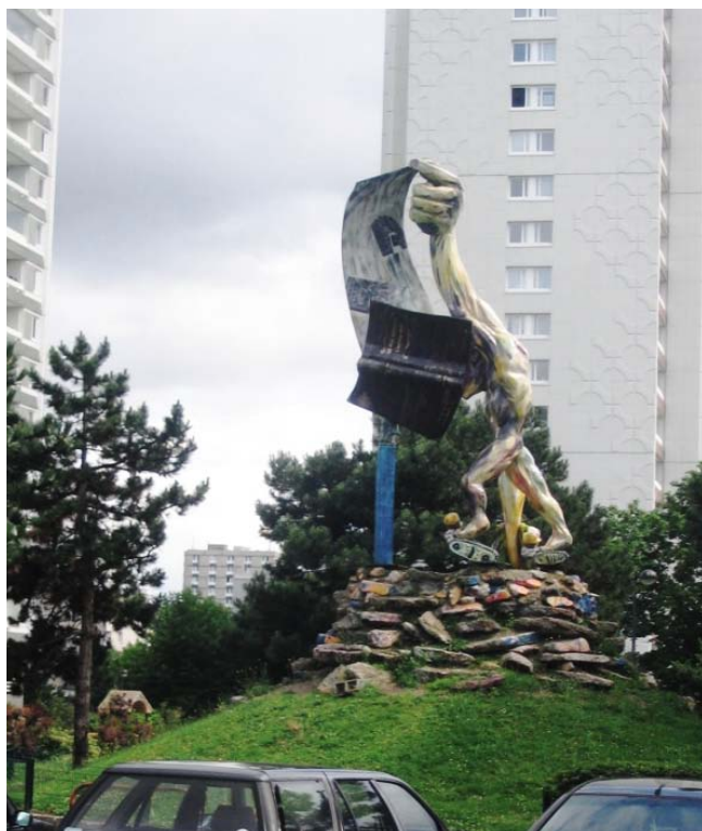
© Denis Merkten, 28 mai 2008.