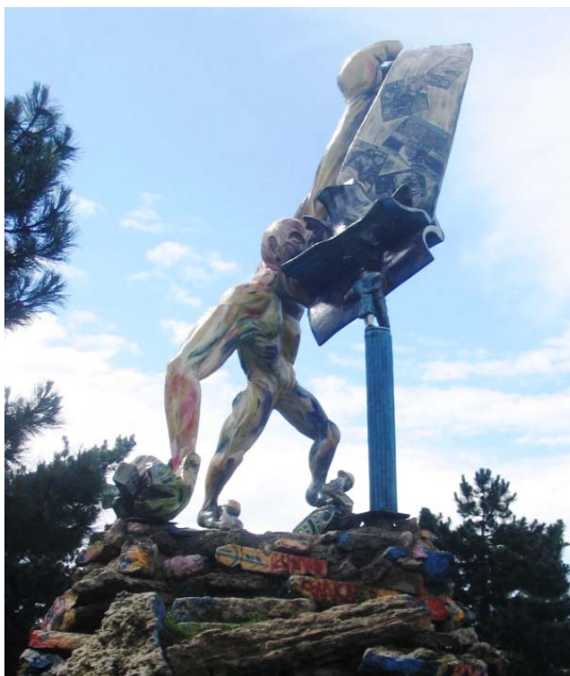
© Denis Merkten, 28 mai 2008.