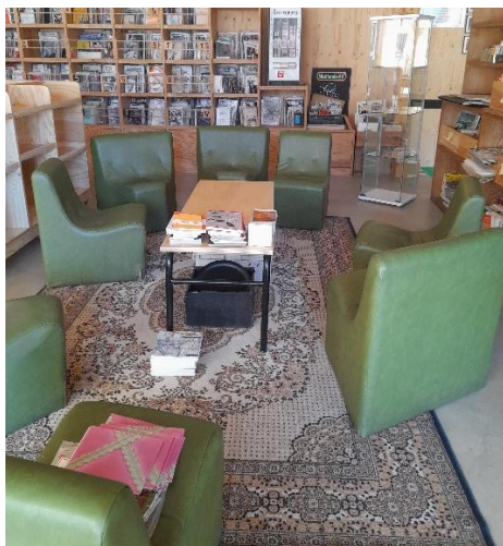
Figure 2 : Photo prise à la Fanzinothèque de Poitiers, espace de lecture

Au Fanzinarium, un regard critique est porté sur l'ameublement. L'espace partagé restreint contraint les fanzinothécaires à l'emploi de mobiliers pliables. A ce jour, l'installation n'est pas jugée satisfaisante : le lieu manque de confort et d'espace pour laisser aux usagers poser leurs affaires. 221, 222