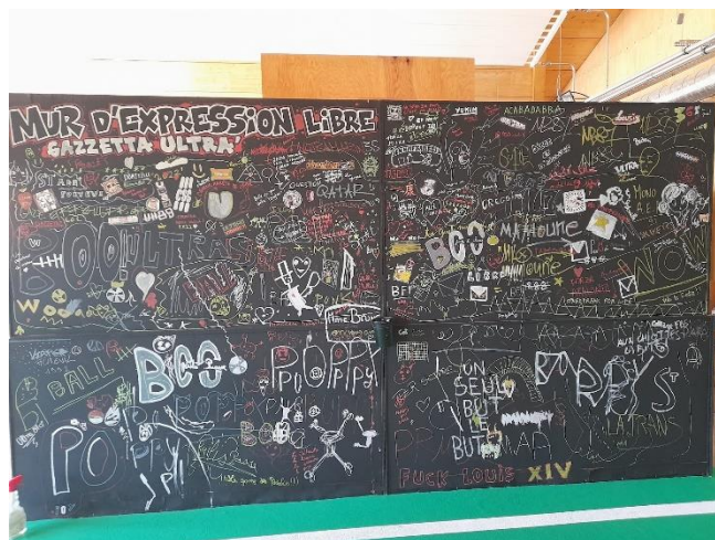
Figure 4: Exposition ULTRAS : 40 ans de fanzines , Fanzinothèque de Poitiers

Beaucoup d'animations proposées appellent une participation active du public. A la Fanzino, l'exposition ULTRAS : 40 ans de fanzines dans le mouvement supporters compte un large mur d'expression libre sur lequel le visiteur est invité à écrire ou dessiner ce qu'il souhaite. 236