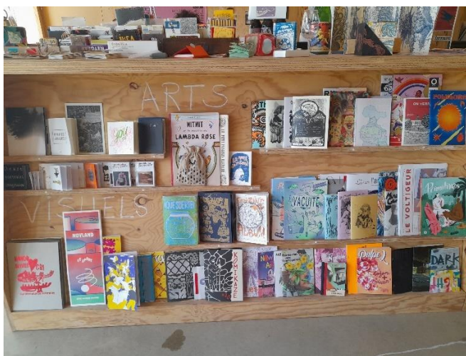
Figure 3 : Fanzines en facing , Fanzinothèque de Poitiers

Notons, par ailleurs, qu'un dénominateur commun parmi ces fanzines aux formats multiples est la finesse de leur dos, trop fin pour permettre de reconnaître un fanzine placé sur la tranche dans l'étagère. Le facing représente donc, dans l'agencement des documents, une stratégie importante, allant au-delà du rôle de valorisation qui lui est attribué en bibliothèque. 226