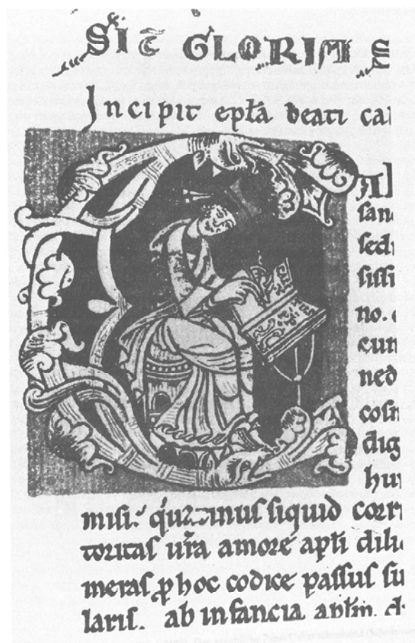
I. Codex Calixtinus, fol. 1 r . Le pape Calixte rédige le Liber sancti Jacobi.

Je remercie également le personnel de la bibliothèque inter-universitaire de Lyon pour la qualité de leur accueil et de leurs conseils.