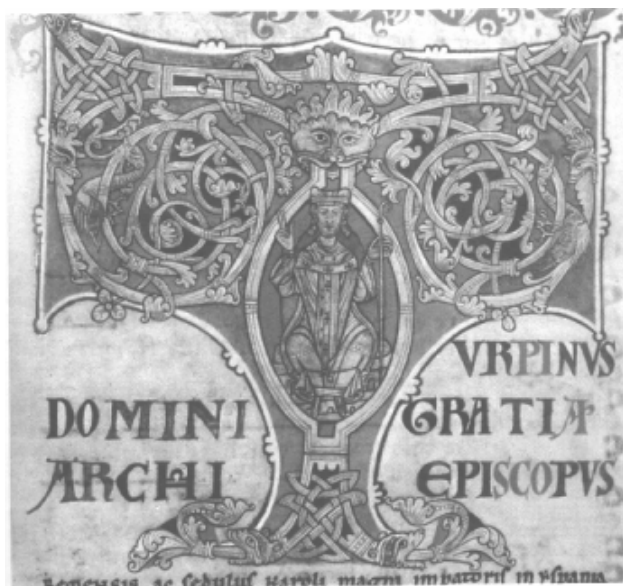
XV. Chronique du Pseudo-Turpin , fol. 1 r [ Codex Cal. , fol. 163 r ]. En frontispice de la Chronique qui lui est attribuée, l'archevêque Turpin bénissant.

Le Liber sancti Jacobi est une œuvre complexe, difficile à cerner et donc à étudier, d'une part à cause de notre éloignement chronologique et d'autre part en raison de sa grande diversité de tons selon les cinq livres qui la composent. En effet, entre guide religieux et spirituel, chanson de geste et guide de pèlerinage, contenant à la fois illustrations, partitions musicales, messes et récits en tout genre, le Codex Calixtinus laisse aux chercheurs encore bien des pistes à explorer.